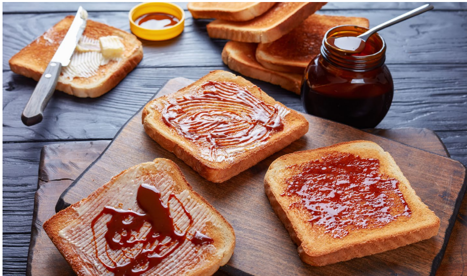
Quand la pâte à tartiner Marmite vient à manquer : des rayons vides à la suite d'une pénurie de levure en provenance des brasseries, conjuguée à une hausse de la demande.

Dans le même temps, à la suite des perturbations que connaissent les chaînes d'approvisionnement mondiales, de nombreux produits sont en rupture de stock, des puces pour automobiles à la pâte à tartiner Marmite (en raison vraisemblablement d'une pénurie de levure consécutive à la fermeture des brasseries lors des confinements, alors que la demande pour le produit a augmenté), ce qui se traduit par une pression sur les coûts de production, qui est répercutée sur le consommateur lorsque les fabricants disposent d'un pouvoir de fixation des prix. Dans un tel contexte, l'accent placé par notre stratégie sur les entreprises et les secteurs bénéficiant de solides avantages concurrentiels est un atout clé, car ces